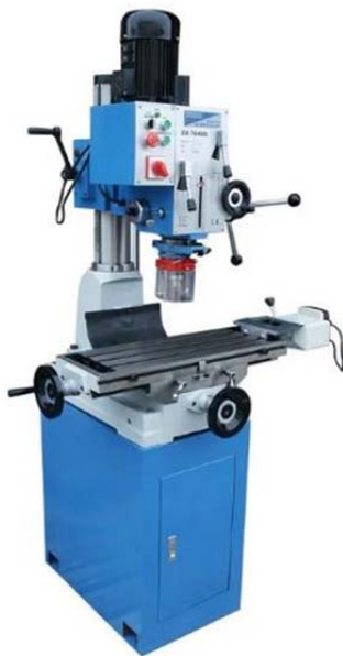
Bohr- und Fräsmaschine