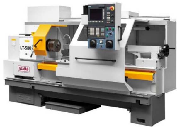
CNC gesteuerte Drehmaschine